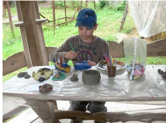
Cangurașii din București

Rezolvând rebusul, veți descoperi pe verticala A-B numele unui bun prieten: